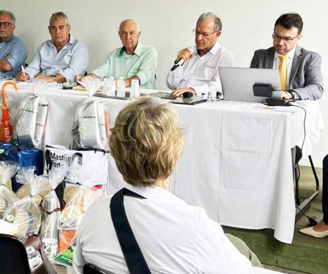
■ Registros de distribuição de brindes aos associados presentes na assembleia

Candiotto ressaltou ainda as articulações junto ao Governo Federal para conter essas importações e mencionou a expectativa por decisões relacionadas a medidas antidumping. Como ponto positivo, destacou o anúncio de inclusão de produtores de cooperativas mistas nos programas de incentivo do próximo Plano Safra.